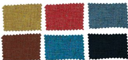
Amplia gama de colores de telas